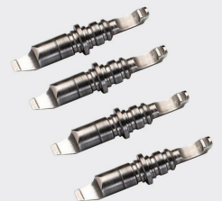
Kit 16 puntali speciali per aggrappi