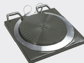
Coppia piatti rotanti in alluminio completi di tampone 450x450 mm spessore 50 mm Portata 1000 Kg