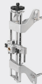
Aggrappi autocentranti a 4 punte con frizione